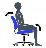
Blocage du basculement