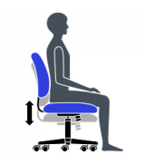
Hauteur du siège