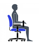
Hauteur de l'accoudoir