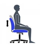
Hauteur du dossier et support lombaire