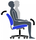
Mouvement de basculement central