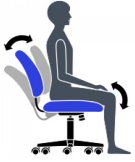
Réglage de la tension