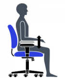
Hauteur de l'accoudoir