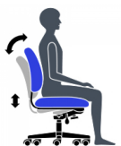
Mouvement de basculement synchronisé