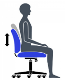
Hauteur du dossier et support lombaire