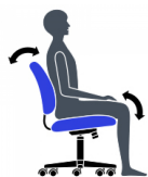
Blocage du basculement