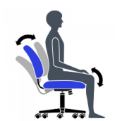
Réglage de la tension