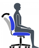
Inclinaison du dossier